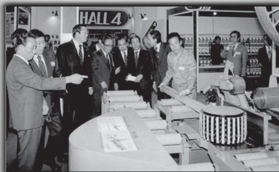
‘77年韓国機械展参観中の故朴正熙大統領