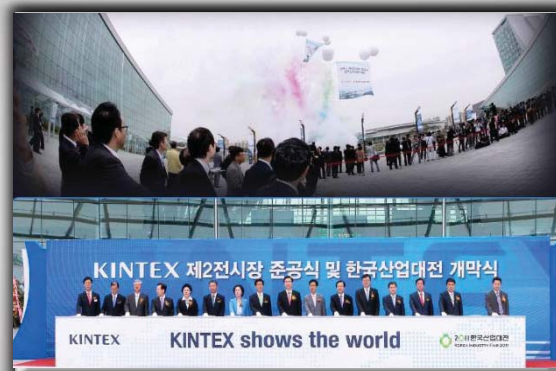
‘11年韓国機械展開幕式及び KINTEX 2展示場竣工式